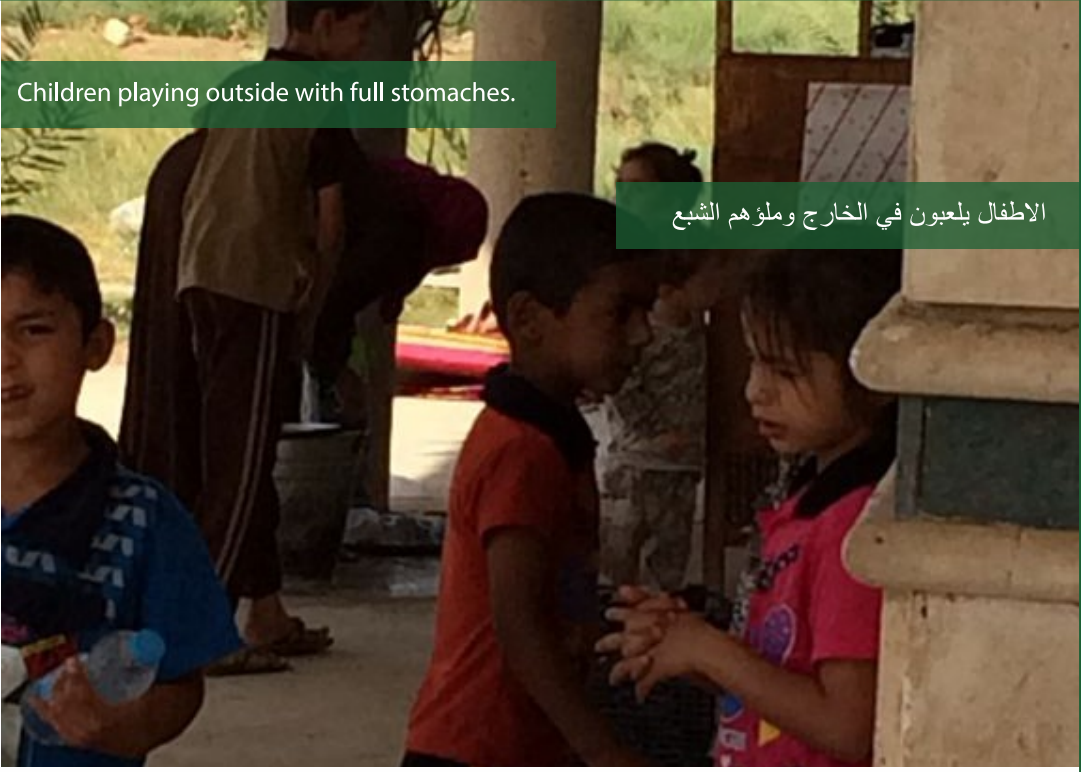
الاطفال يلعبون في الخارج وملؤهم الشبع