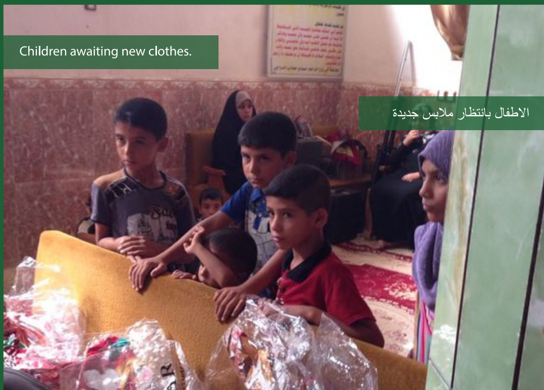
الاطفال بانتظار ملابس جديدة