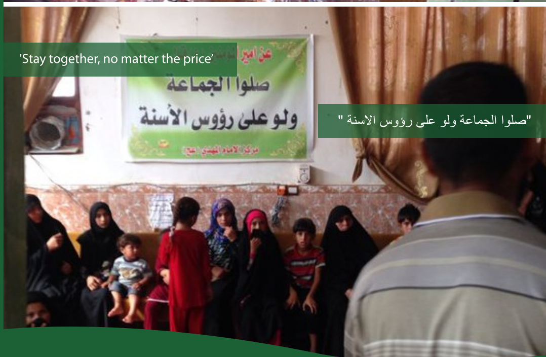
"صلوا الجماعة ولو على رؤوس الاسنة"