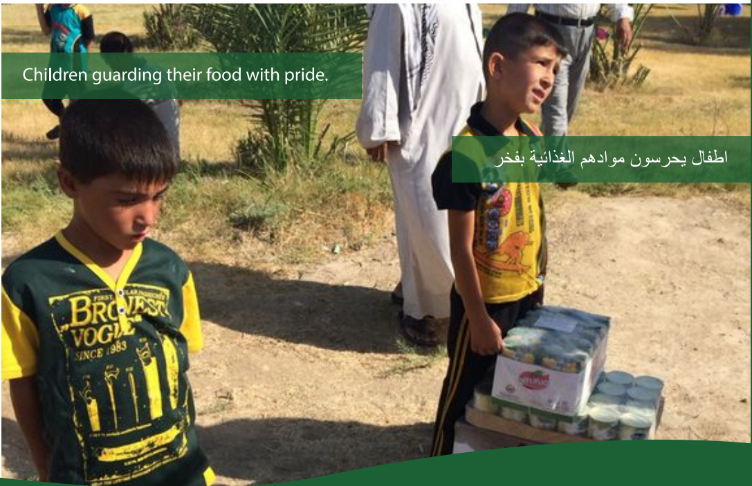
اطفال يحرصون موادهم الغذائية بفخر