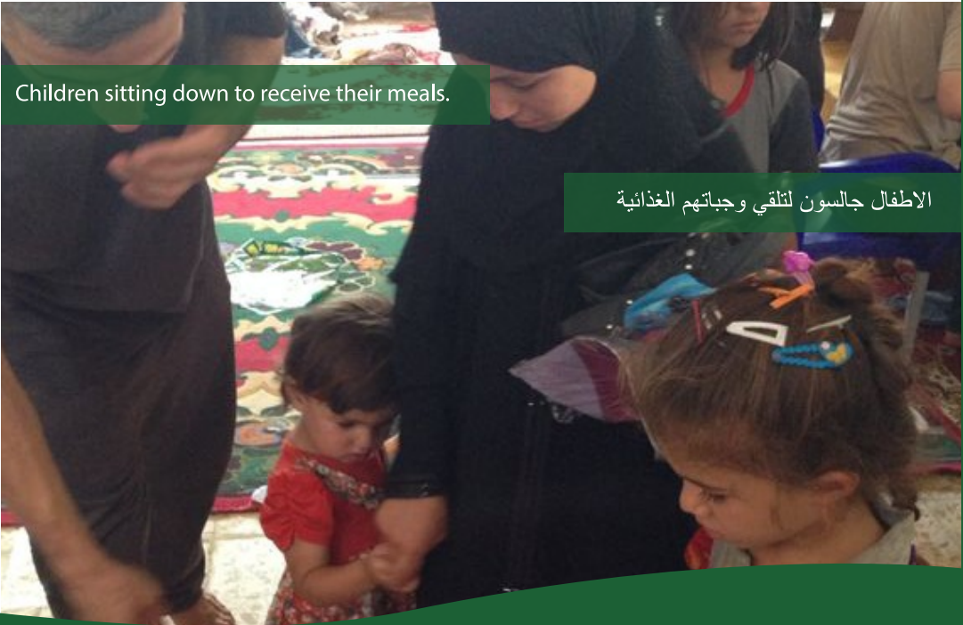
الاطفال جالسون لتلقي وجباتهم الغذائية