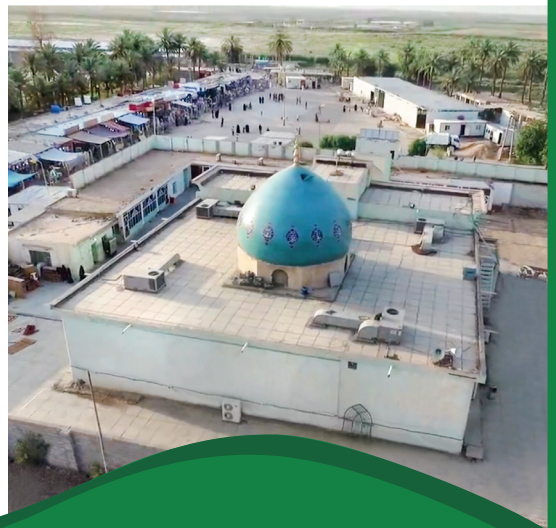
تجديد جامع ومرقد السيد تاج الدين، حفيد الامام السجاد (ع) Taj Al-Deen Shrine Renovation